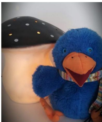
Raai de Kraai